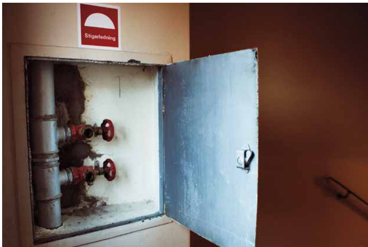
Via stigarledningen i trapphuset får räddningstjänsten vattenförsörjning utan att behöva dra slangar hela vägen från bottenvåningen.